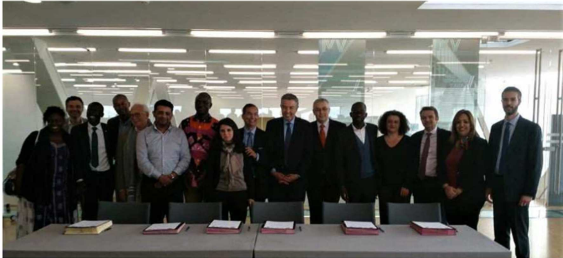
Réunion des partenaires à la Villa Méditerranée, à Marseille.

Grâce au fonds de l'Union Européenne (EuropAid), le projet Diafrinkinvest sera lancé avec pour ambition d'appuyer la mobilisation des diasporas au service du développement du Maroc, Sénégal et de la Tunisie, afin de renforcer durablement l'engagement des hauts potentiels et entrepreneurs de ces diasporas dans la création d'initiatives ayant un fort impact local, que ce soit par le soutien à l'entrepreneuriat, le renforcement des initiatives locales ou l'investissement. Ce projet sera piloté par ANIMA, en collaboration avec l'ACIM et Am Be Koun, notre partenaire au Sénégal. Dans ce cadre, nous sommes à la recherche de potentiels entrepreneurs de la diaspora qui sont en phase de retour ou qui ont l'intention de mettre en place des entreprises dans leur pays, ainsi que de contacts dynamiques au sein de la diaspora pour faciliter le partage de l'information et la mobilisation pour participer à ces forums.